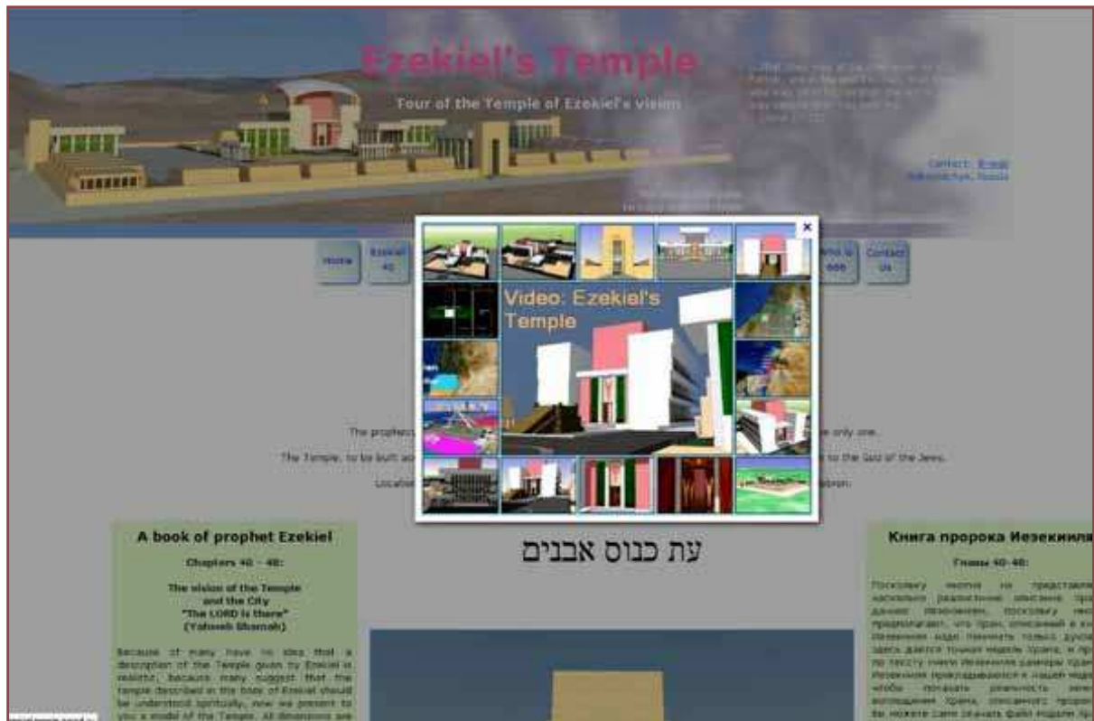
Yksi Hesekielin temppeleä käsittelevä nettisivusto

muuttunut paratiisimaiseksi rauhan tyysijaksi, asuisi kuitenkin edelleen syntiinlankeemuksen alainen ihmiskunta, jonka olisi tehtävä oma ratkaisunsa Jumalan puoleen. Temppele, temppelepalvelus ja