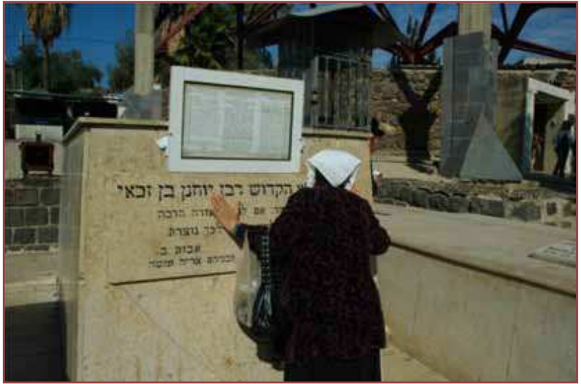
Kuuluisan rabbi ben Zakkain hauta

matullista tosiseikkaa, että Messias, Jeesus, on jo yhdistänyt juutalaiset ja pakanat Jumalan seurakunnaksi. Juutalaisen kansan jäännöksen tuleva kääntyminen (Sak.12:10: ”He katsovat minuun, jonka he ovat lävistäneet. Ja he valittavat häntä, niinkuin valitetaan ainokaista, murehtivat häntä katkerasti, niinkuin murehditaan katkerasti esikoista”) suuressa ahdistuksessa on erillinen tapahtuma ja sitä seuraa välittömästi Kristuksen toinen tulemus (Matt. 23:39: ”Sillä minä sanon teille: täst’edes te ette näe minua, ennenkuin sanotte: ’Siunattu olkoon hän, joka tulee Herran nimeen’”).