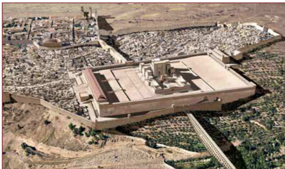
Temppeli Jeesuksen aikana